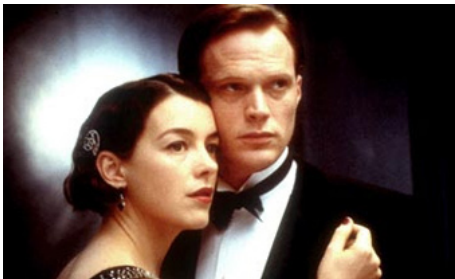
2002 THE HEART OF ME de Thaddeus O'Sullivan avec Paul Bettany