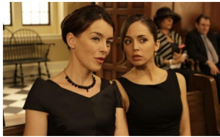
2009 DOLL HOUSE, Haunted d'Elodie Keene avec Eliza Dushku