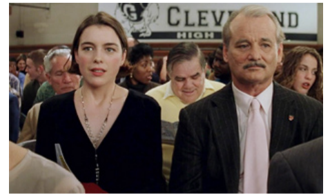
1998 RUSHMORE (Rushmore) de Wes Anderson avec Bill Murray