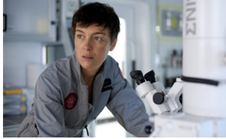
2013 LES DERNIERS JOURS DE MARS (The Last Days on Mars) de Ruairi Robinson