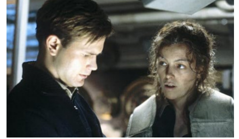
2002 ABÎMES (Below) de David Twohy avec Matthew Davis