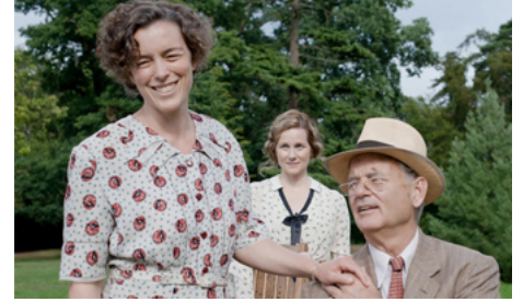
2012 WEEK-END ROYAL (Hyde Park on Hudson) de Roger Michell avec Laura Linney, Bill Murray