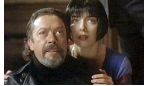
2000 FOUR DOGS PLAYING POKER de Paul Rachman avec Tim Curry