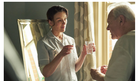
2020 THE FATHER (The Father) de Florian Zeller avec Anthony Hopkins