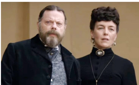
2017 CONFIDENT ROYAL (Victoria and Abdul) de Stephen Frears avec Eddie Izzard