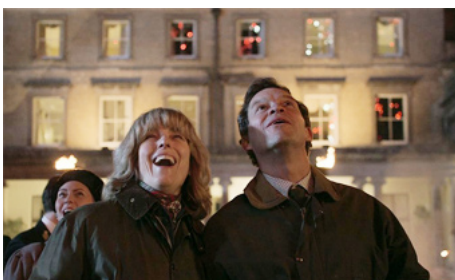
2022 THE CROWN, Gunpowder de May El-Toukhy avec Dominic West