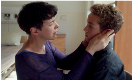
2014 MAPS TO THE STARS de David Cronenberg avec Evan Bird