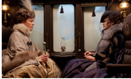
2012 ANNA KARÉLINE (Anna Karenina) de Joe Wright avec Keira Knightley