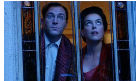
2003 PETER PAN (Peter Pan) de Paul John Hogan avec Jason Isaacs