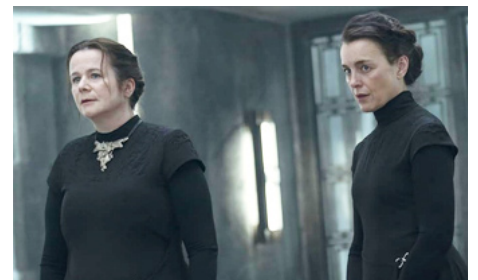
2024 DUNE : PROPHECY d'Anna Foerster avec Emily Watson