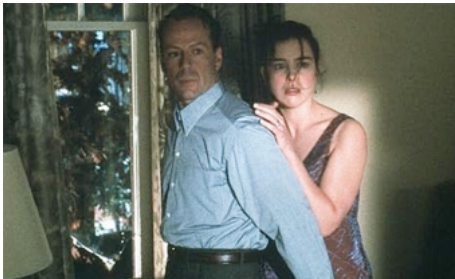
1999 SIXIÈME SENS (The Sixth Sense) de M. Night Shyamalan avec Bruce Willis