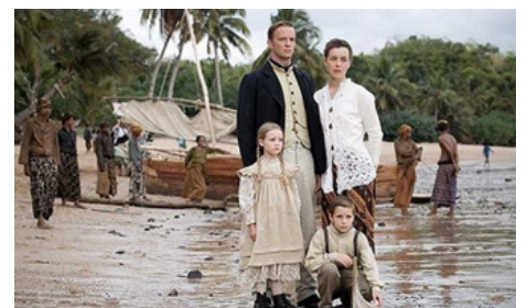
2006 KRAKATOA, THE LAST DAYS de Sam Miller avec Rupert Penry-Jones