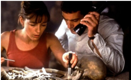
2001 LE TOMBEAU (The Body) de Jonas McCord avec Antonio Banderas