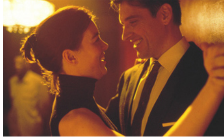
2000 BORN ROMANTIC de David Kane avec Craig Ferguson