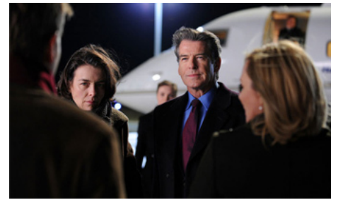
2010 THE GHOST WRITER de Roman Polanski avec E. McGregor, Pierce Brosnan, Kim Cattrall