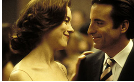
2001 L'HOMME D'ELYSIAN FIELDS (The Man from Elysian Fields) de G. Hickenlooper avec Andy Garcia