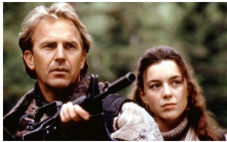
1997 POSTMAN (The Postman) de Kevin Costner avec Kevin Costner