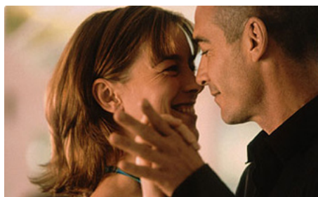
2005 TARA ROAD (Tara Road) de Gillies MacKinnon avec Jean-Marc Barr