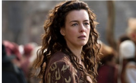
2014 LE SEPTIÈME FILS (The Seventh Son) de Sergueï Bodrov