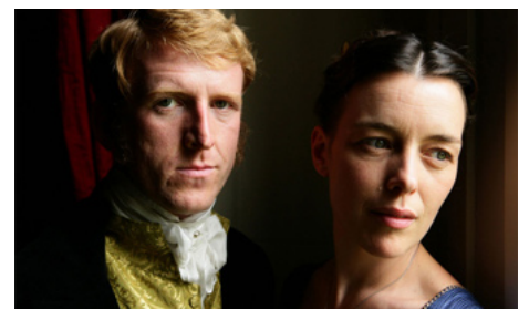
2008 LE CHOIX DE JANE (Miss Austen Regrets) de Jeremy Lovering avec Tom Goodman-Hill