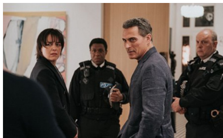
2024 DÎNER À L'ANGLAISE (The Trouble with Jessica) de Matt Winn avec J. Livingston, Rufus Sewell