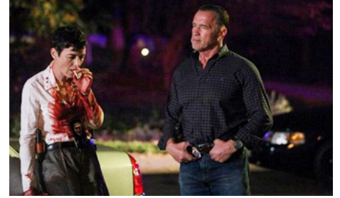
2014 SABOTAGE (Sabotage) de David Ayer avec Arnold Schwarzenegger