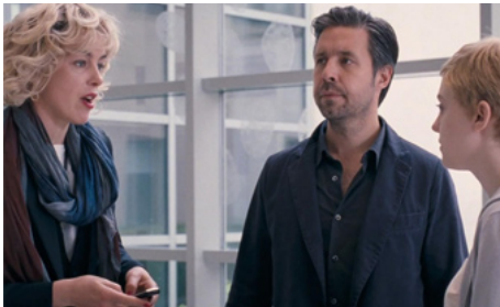
2012 NOW IS GOOD (Now is Good) d'Ol Parker avec Patty Considine, Dakota Fanning