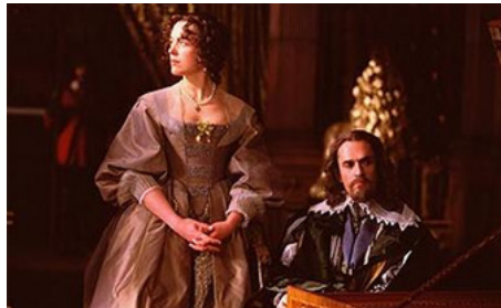
2003 LA MORT D'UN ROI (To Kill a King) de Mike Barker avec Rupert Everett