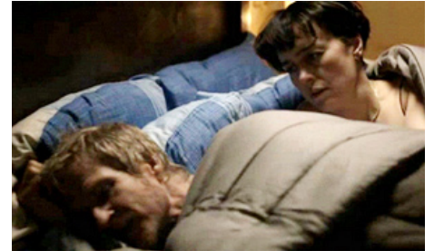
2014 ALTAR (Altar) de Nick Willing avec Matthew Modine